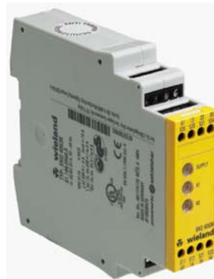
Рис. 2. Реле безопасного отключения серии «4000»

Различие связано в первую очередь с тем, что внутренняя электрическая схема сертифицированного устройства безопасности по сравнению со схемой PLC обладает более высокой надежностью за счет применения принципа резервирования.