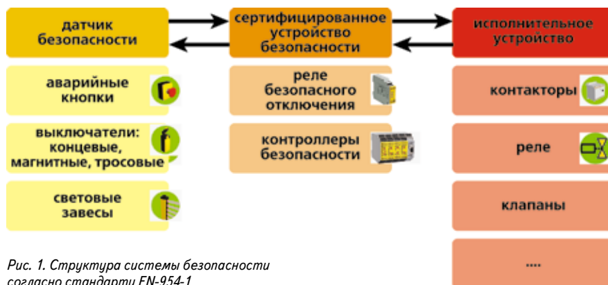
Рис. 1. Структура системы безопасности согласно стандарту EN-954-1

● В системе безопасности установки должны обнаруживаться все возможные неисправности