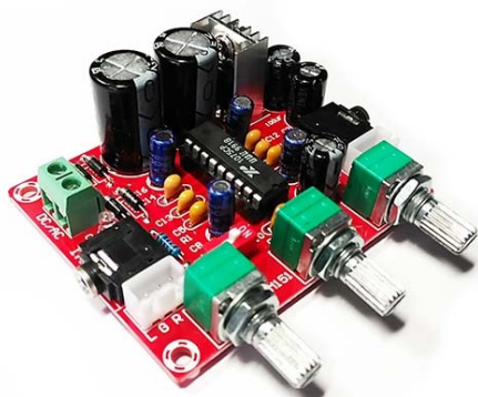
Общий вид устройства

Высококачественный компактный стереофонический темброблок предназначен для регулирования тембра высоких и низких частот с регулировкой уровня громкости в стерео аппаратуре высокого класса. Модуль рассчитан на питание как постоянным так и переменным напряжением напрямую от трансформатора. На модуле, для быстрого подключения установлены гнезда для кабеля с разъёмами типа jack 3.5 мм. Будет полезен в качестве предварительного усилителя аудио комплекса и будет незаменим для модернизации устаревших усилителей мощности НЧ.