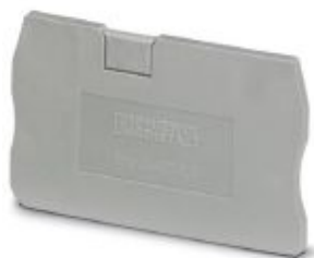
Концевая крышка, длина: 48,6 мм, ширина: 2,2 мм, высота: 29,1 мм, цвет: серый

Обратите внимание на то, что приведенные здесь данные взяты из online-каталога. Полная информация и данные содержатся в документации пользователя. Действуют Общие условия использования для информации, загруженной из интернета. ( http://phoenixcontact.ru/download )