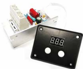
Общий вид устройства. Рис.1

Устройство предназначено, для регулировки мощности нагрузки до 10000 Вт в цепях переменного тока с напряжением 220 В. Устройство построено на базе мощного симистора ВТА100 и предназначено для регулирования мощности электронагревательных, осветительных приборов, коллекторных и асинхронных электродвигателей переменного тока и т.п. Применение данного симистора позволяет уменьшить размер радиатора охлаждения. Благодаря широкому диапазону регулировки и большой мощности регулятор найдет широкое применение в быту.