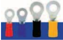
Сечение провода: 0,5-1,5мм 2 ; (A.W.G22-16) I max =19A Материал: медь. Толщина: 0,75мм