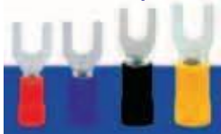
Сечение провода: 0,5-1,5мм 2 ; (A.W.G22-16) I max =19A Материал: медь. Толщина: 0,75мм