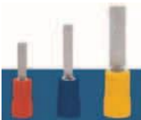
Сечение провода: 0,5-1,5мм 2 ; (A.W.G22-16) I max =19A Материал: медь. Толщина: 0,75мм