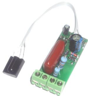
Рис.1 Общий вид устройства (показано без защитной термоусадочной трубки)

В устройстве предусмотрена функция автоматического отключения нагрузки через 12 (+-2 часа) часов после включения. Это может быть полезно, например, когда Вы забыли выключить свет в комнате.