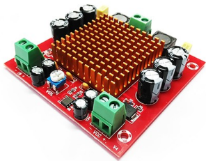
Общий вид устройства. Рис.1

Общий вид устройства представлен на рис.1