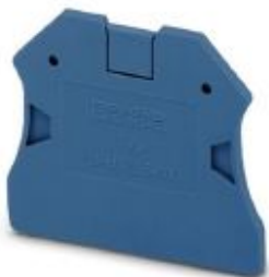
Концевая крышка, длина: 47 мм, ширина: 2,2 мм, высота: 39,8 мм, цвет: синий

Обратите внимание на то, что приведенные здесь данные взяты из online-каталога. Полная информация и данные содержатся в документации пользователя. Действуют Общие условия использования для информации, загруженной из интернета. ( http://phoenixcontact.ru/download )