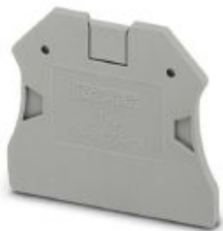
Концевая крышка, длина: 47 мм, ширина: 2,2 мм, высота: 39,8 мм, цвет: серый

Обратите внимание на то, что приведенные здесь данные взяты из online-каталога. Полная информация и данные содержатся в документации пользователя. Действуют Общие условия использования для информации, загруженной из интернета. ( http://phoenixcontact.ru/download )